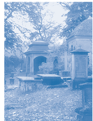
Gräberfeld auf dem Nikolaifriedhof in Görlitz