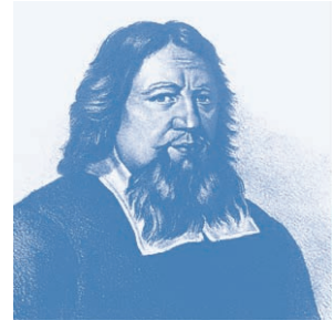
Jesper Swedberg (1653 – 1735)

1709 schloss Swedenborg seine Studien ab und brach im darauf folgenden Jahr zu einer mehrjährigen Bildungsreise auf, die ihn zunächst nach London führte. Täglich las er Isaac Newton und suchte in den Kaffeehäusern die Gesellschaft junger Wissenschaftler und Mathematiker. Von London ging er nach Greenwich, wo er den Direktor des königlichen Observatoriums, John Flamsteed, aufsuchte und sogar dessen Assistent werden konnte. In Oxford lernte er Sir Edmond Halley kennen und weilte in der Bibliotheca Bodleiana. Weitere Stationen waren Leyden, wo er den Pionier der Mikroskopie, Anton van Leeuwenhoek, besuchte, Utrecht und Paris.