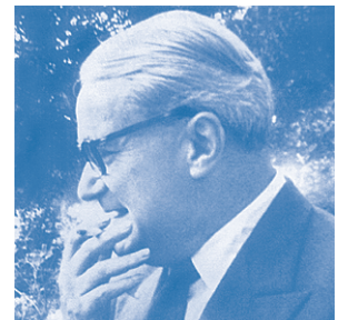
Henry Corbin (1903 – 1978 ) Orientalist an der Sorbonne