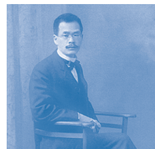
Daisetz Teitaro Suzuki (1870 – 1966 ) Zen-Meister und Übersetzer Swedenborgs