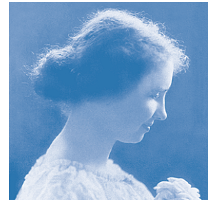
Helen Keller (1880 – 1968 ) Tauben und blinde Schriftstellerin

»Swedenborgs theologische Lehre ähnelt der des Buddhismus sehr. Wir sollen das Eigene verlassen (die Illusion der Führung durch das eigene Ich). Erlösung beruht auf der Übereinstimmung von Glaube und Tat. Das Göttliche ist seinem Wesen nach Weisheit und Liebe, doch die Liebe ist höher und tiefer als die Weisheit. Die göttliche Vorsehung gewinnt über alles die Oberhand, über das Grosse und das Kleine. Nichts in der Welt ist zufällig. Die göttliche Vorsehung ist in jedem Jota enthalten, in dem die Verwirklichung der Liebe und Weisheit erkennbar ist. Jeder dieser Punkte dürfte Schüler der Religion interessieren, besonders aber Buddhisten.«