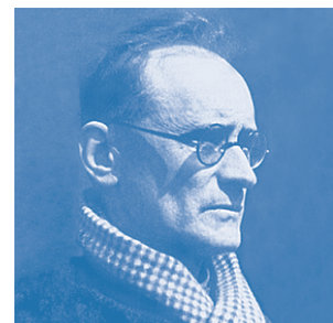
Anton von Webern (1883 – 1945 ) Komponist und Schüler von Arnold Schönberg