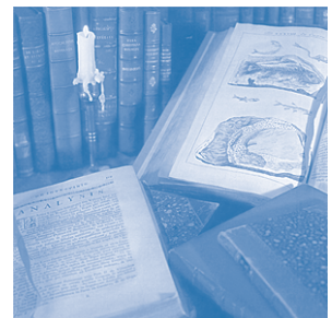
Stillleben mit Werken Swedenborgs

»Ich sehe voraus, dass viele Leser das Folgende samt den Visionsberichten nach den einzelnen Kapiteln für Erfindungen der Phantasie halten werden. Doch ich versichere im Namen der Wahrheit, dass es sich dabei keineswegs um Phantasieprodukte handelt, sondern um wirklich Geschehenes und Gesehenes. Auch habe ich es nicht in einem schläfrigen Gemütszustand gesehen, sondern im völligen Wachsein. Denn es hat dem Herrn gefallen, sich mir zu offenbaren und mich zu senden, um die Theologie für jene neue Kirche zu lehren, die in der Apokalypse unter dem neuen Jerusalem verstanden wird. Zu diesem Zweck hat er das Innere meines Gemütes und Geistes geöffnet und mir verliehen, bei den Engeln in der geistigen und zugleich bei den Menschen in der natürlichen Welt zu sein, – und das nun schon seit fünfundzwanzig Jahren.«